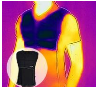
POWERCOOL SX3 SHIRT >>