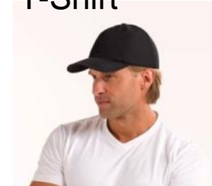
Basecaps und viele mehr

Mehr unter https://shop.e-cooline.de/kuehlung-fuer-tiere