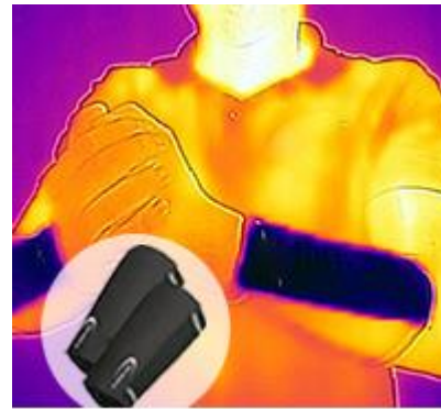
POWERARMCOOLER SX3 >>