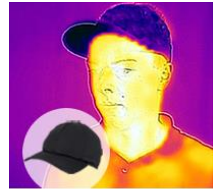
POWERCOOL SX3 BASECAP >>

Körper des Menschen: Wärmebilder Infrarot E.COOLINE®